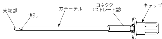
スタンダード型カテーテルにキャップを付けた状態で例示