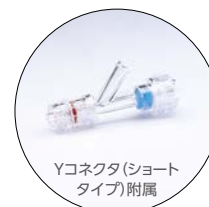
Yコネクタ(ショートタイプ)附属

※本製品を使用するには、必ず添付文書をお読みください。 ※本カタログに掲載の仕様・形状は改良等の理由により予告なく変更することがありますのでご了承ください。