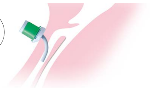
柔軟に曲がる チューブ

気管への圧迫を最小限に抑えるよう設計されたラセン入シリコンチューブは柔軟性に優れ、新生児・小児などのデリケートな気管に最適なチューブです。