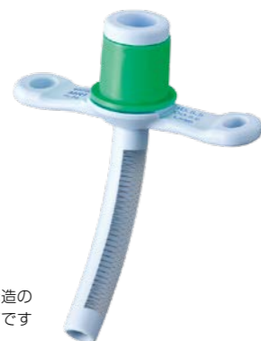
ラセン構造のイメージです

シリコンの柔軟性を損なわない、極細に設計されたチタン合金製ラセンをチューブ内に施し、チューブのキンキングや圧迫つぶれを防止する安心構造になっています。