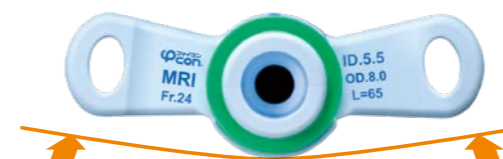
カーブ形状のウイング

気管形状に合わせてデザインしたシリコン製チューブがスムーズな挿入を実現します。穏やかなカーブ形状のウイングは装着時にやさしくフィットします。