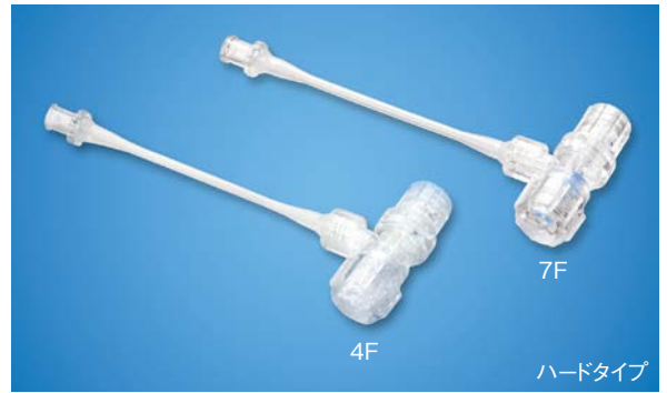
[規格・仕様] [リビオドール ※1 / Onyx ※2 対応型]